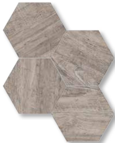
229109 Moss Taupe 15X17 / 5.9"X6.7"