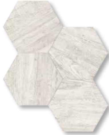
229105 Moss White 15X17 / 5.9"X6.7"