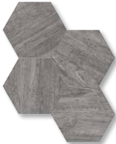
229107 Moss Gray 15X17 / 5.9"X6.7"